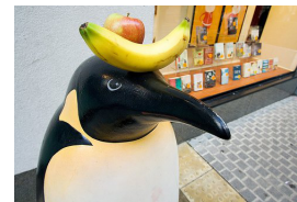
FIGURE 1 – Exemple d'image étiquetée comme "bibliothèque".

Afin de transférer les connaissances du jeu de données gé-