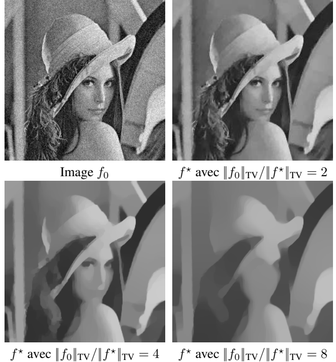
FIG. 1 – Exemples de débruitage par projections sur la boule TV pour différents \tau calculées par notre algorithme.

Comme le coût d'une itération de l'algorithme de Nesterov est environ le double de celui des autres algorithmes, nous montrons en fait l'erreur générée par f^{(k/2)} au lieu de f^{(k)} pour la courbe de la méthode de Nesterov. Ceci montre que les vitesses observées coïncident avec les prédictions théoriques, et que l'algorithme de projection dual avec itérations de Nesterov est plus rapide que les deux autres méthodes.