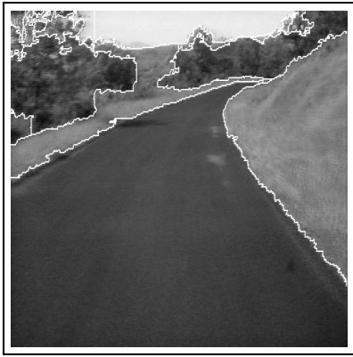
FIG. 1 — Résultat de segmentation.