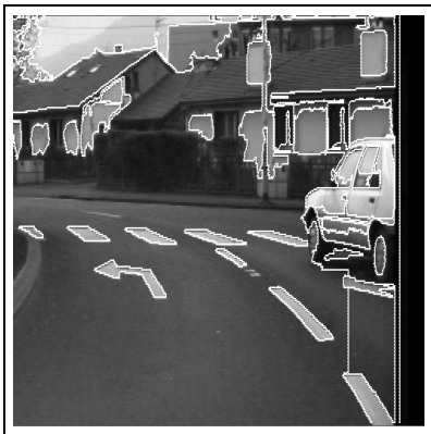
FIG. 2 — Résultat de segmentation.

de donnée du GdR TDSI (figure 3). Les différentes segmentations sont évaluées par rapport à la segmentation idéale, connue a priori, en utilisant la mesure de Vinet. Celle-ci, présentée dans [VIN91], mesure la distance entre deux segmentations. Une faible valeur de la mesure correspond à deux segmentations très proches, tandis qu'une forte valeur représente deux cartes de régions assez éloignées.